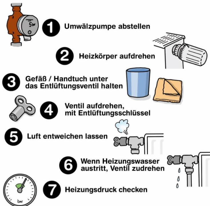
Abbildung 3: Heizung entlüften Schritt für Schritt